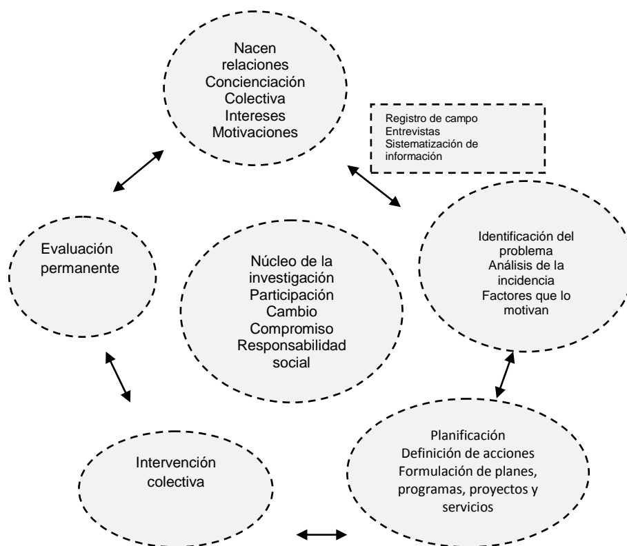
Figura 1. Proceso de investigación acción

El proceso de reconceptualización y resignificación de la orientación para la prevención implicó la configuración del procedimiento reflexivo que presentamos en la fig. 1: