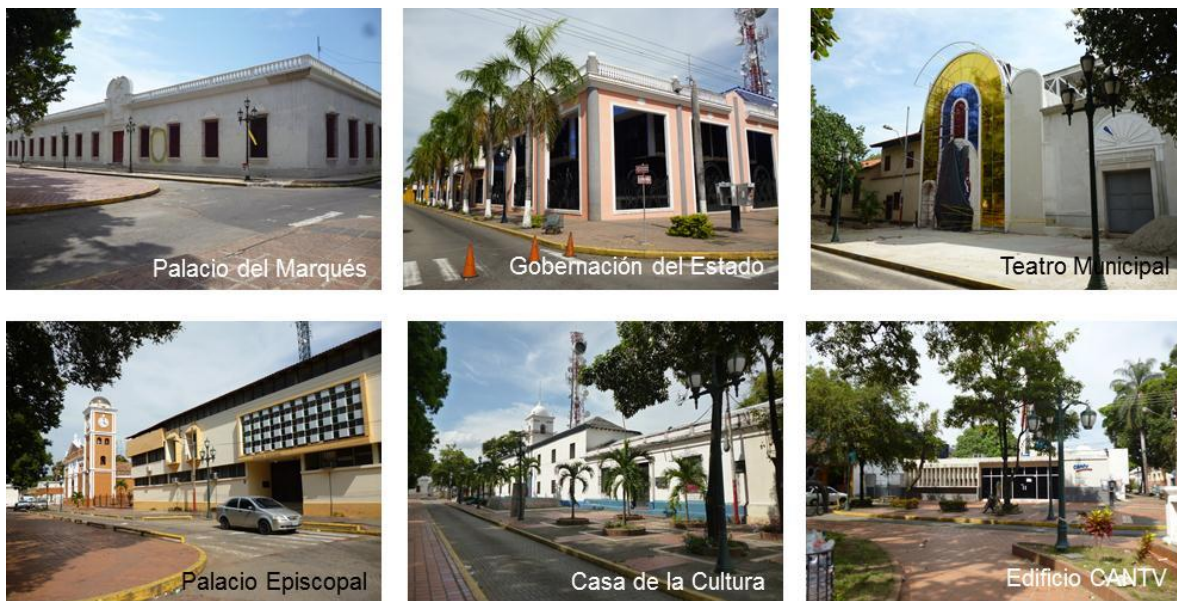
Figura 5. Edificaciones emplazas al perímetro de la plaza Bolívar

En términos descriptivos se puede observar que por los costados la plaza Bolívar, esta confinada por edificaciones de varias edades y de estilos que de cierta manera se contraponen unos con respecto a otros, pues en aras de una reminiscencia del estilo colonia propio del Palacio del Marqués y de la Casa de la Cultura “Napoleón Sebastián Arteaga”; emergen la Gobernación del Estado Barinas y el Teatro Municipal, los cuales son edificaciones que presentan cierto valor arquitectónico dentro del perímetro de la plaza Bolívar y sin embargo, por la necesidad de situarles en las nuevas tendencias de la tectónica arquitectónica, se hace uso de materiales que disgregan el lenguaje que con el transcurrir de los años, había sobrevivido en dicho espacio. Figura 5