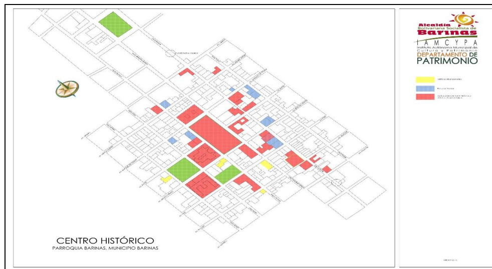
Figura 1. Poligonal Casco Histórico de Barinas

Puesto que en ellos no solamente se valorizan las manifestaciones del acontecer político-institucional, sino especialmente los testimonios de una conformación cultural-arquitectónica que se va enriqueciendo a través del tiempo.