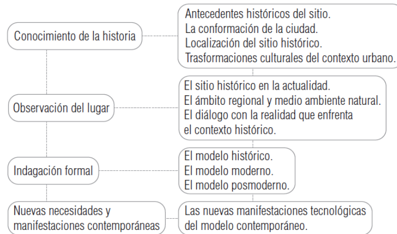
Figura 2. Método de interpretación de la realidad

edificaciones, conexión histórica y arquitectónica y descripción del valor dentro del acervo local.