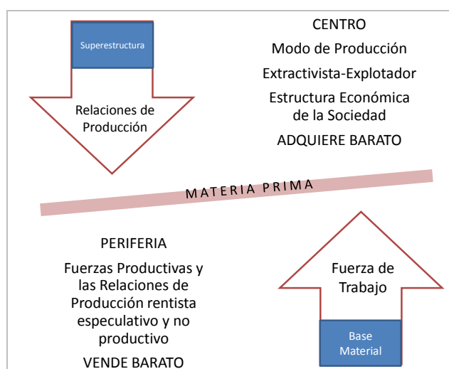
Figura 1. Relación centro-periferia