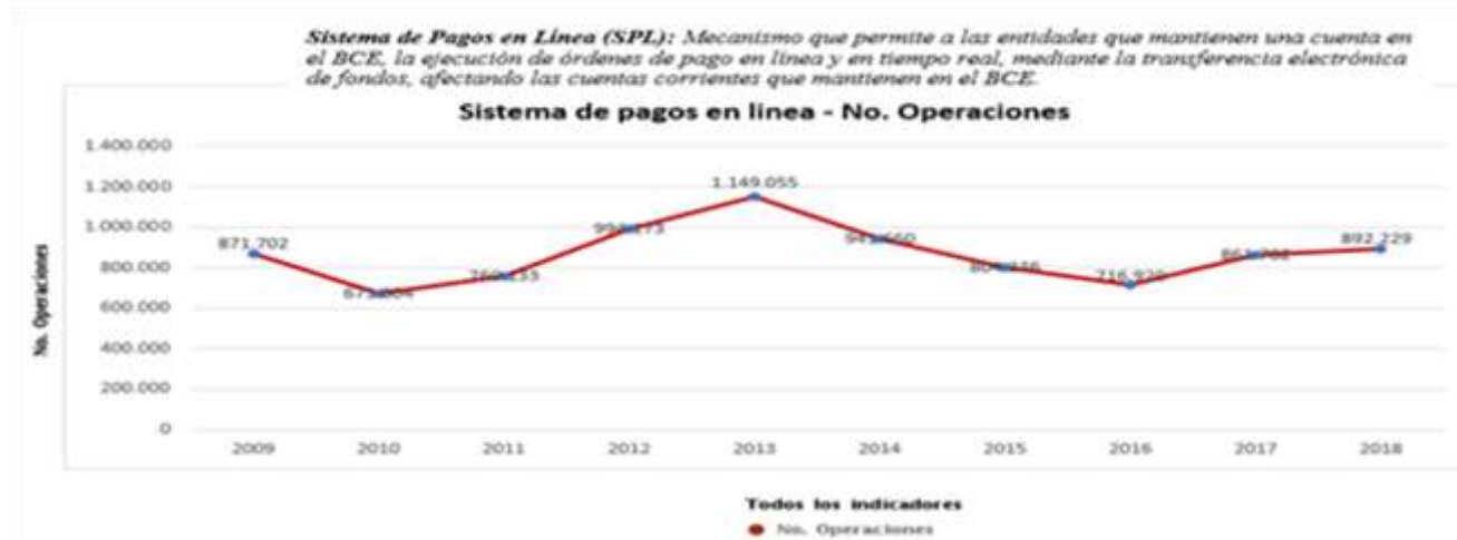
Gráfico 1: Sistema nacional de pagos

luego definir sus funciones basados en estos lineamientos.