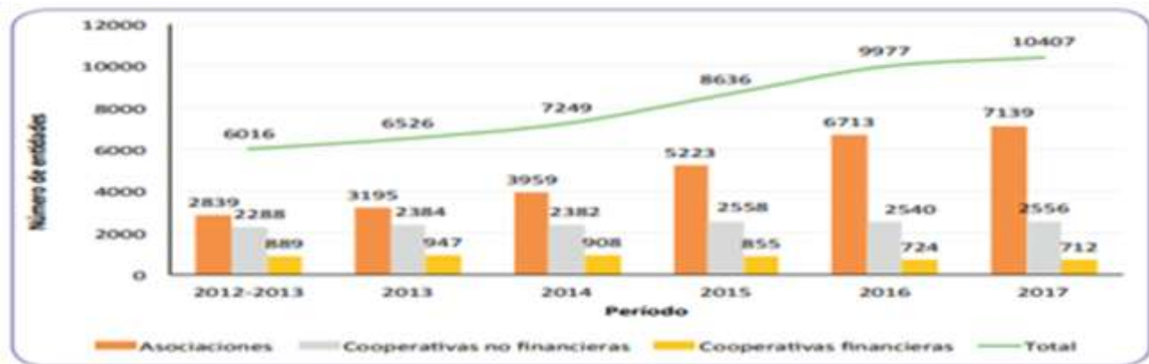
Gráfico 2: Inclusión Económica y social