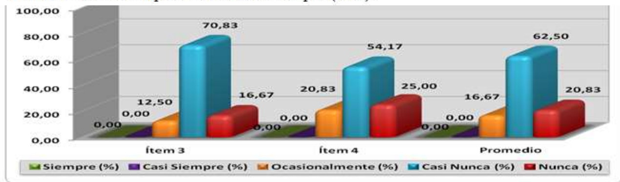
Distribución de Frecuencia y Porcentaje del Indicador "Políticas de Control" (Dimensión: Normas de Control).