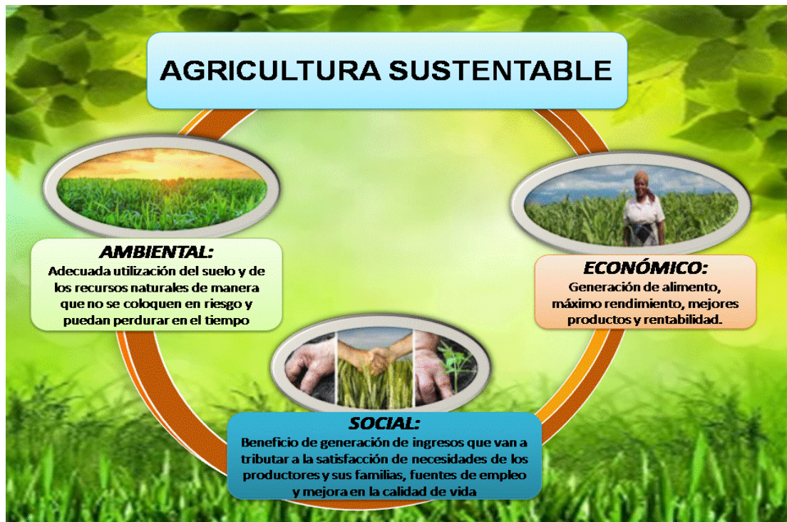
Figura 1: Agricultura sustentable

Estas ideas sobre la agricultura sustentable, permiten visualizar una manera diferente de concebir esta práctica socio ambiental, de cara a los retos que exige el momento vivido, lo cual se resumen en la siguiente imagen: