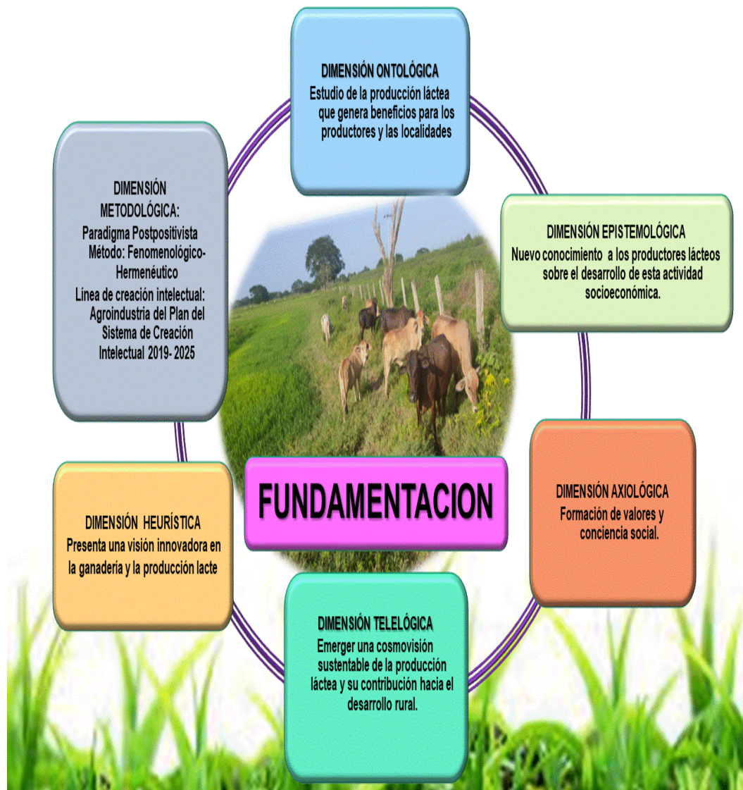
Figura 2: Fundamentación de la cosmovisión

Estas ideas se presentan de manera resumida en la siguiente imagen: