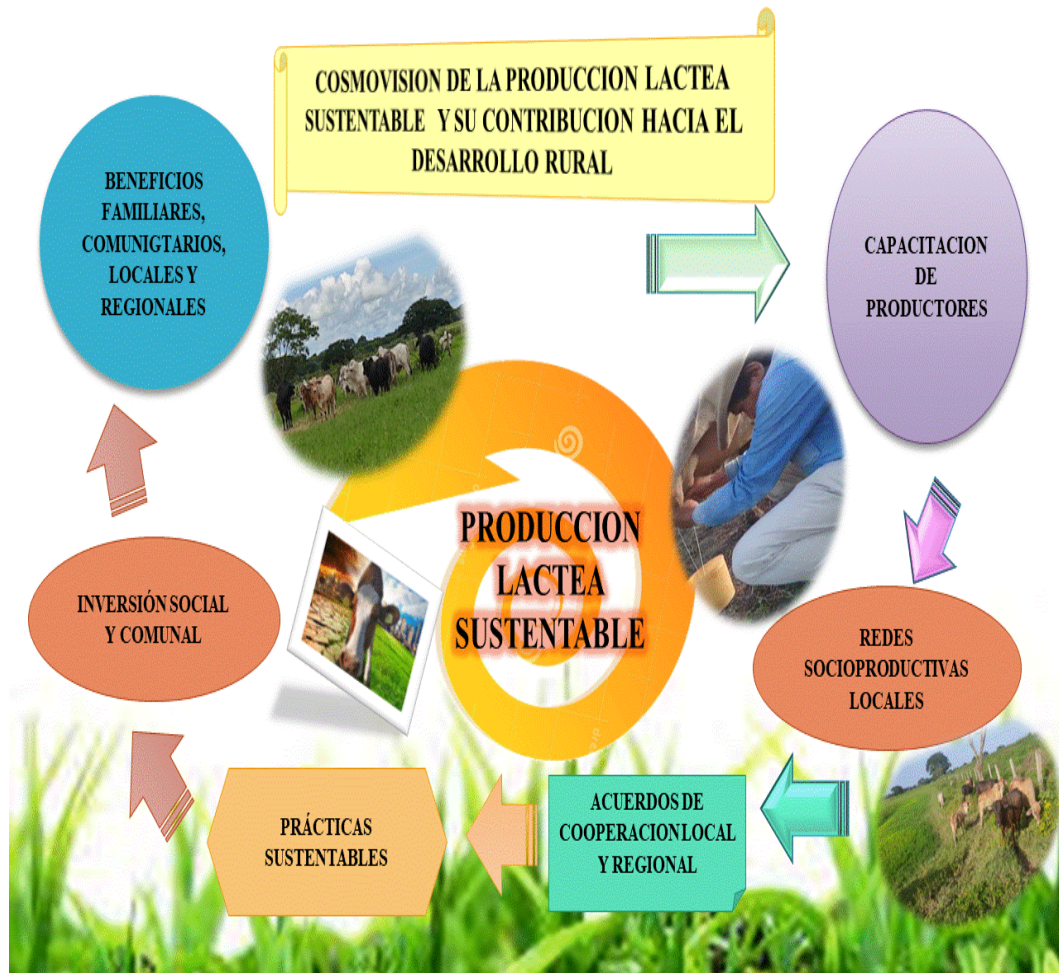
Figura 3: Cosmovisión de la Producción Láctea

Este recorrido teórico permitió la generación de una cosmovisión de la producción láctea sustentable y su contribución hacia el desarrollo rural, la cual emerge de lo que es la visualización que hace la investigadora partiendo de la realidad, donde se considera que el conocimiento debe tener una pertenencia y correspondencia social, y este estudio presenta estas líneas de orientación, además que la realidad vivida demanda de que se utilice ese conocimiento con una profunda utilidad social, para beneficiar al colectivo, siendo una excelente oportunidad para el estudio de la producción láctea como actividad socioeconómica de impacto ambiental y lo que es su contribución hacia el desarrollo rural.