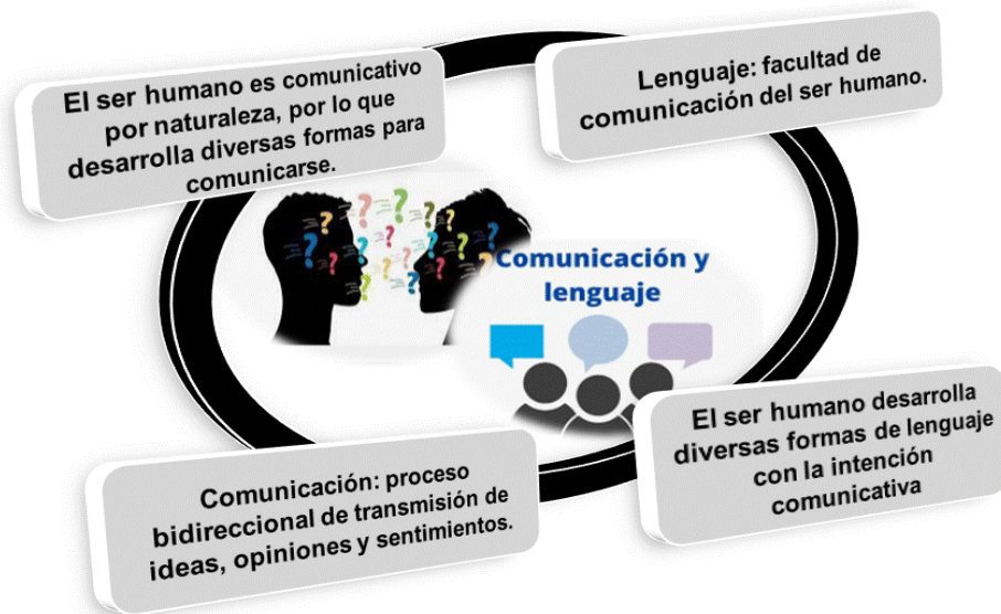
Figura 1: Lenguaje y Comunicación.

Asimismo, se realizó un proceso de estructuración, en atención a las categorías emergentes y las subcategorías, tal como se presenta en la siguiente figura: