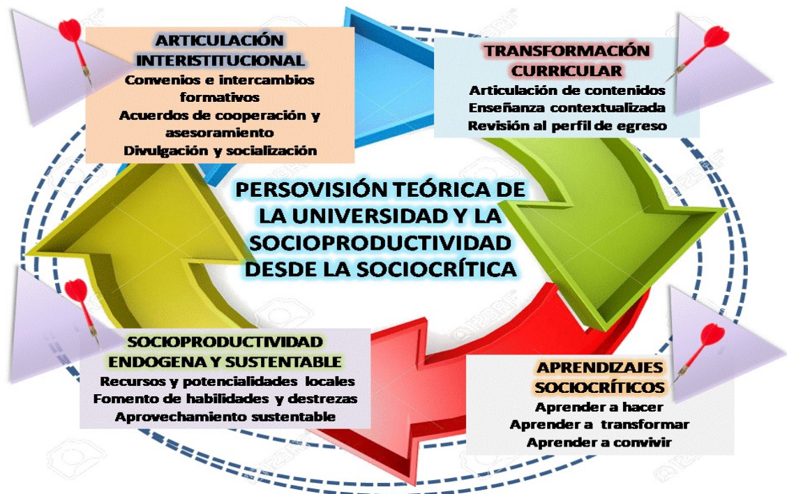
Figura 2: Holograma de la construcción teórica.

En lo heurístico , es un aporte innovador que considera diferentes aspectos de la educación universitaria, por cuanto la labor formativa debe partir por el hacer y transformar lo que se viene gestando en las universidades para ser capaces de propiciar un escenario donde se valora el saber, el episteme y las prácticas que vengán a reforzar la manera de aprender de los estudiantes, generando un escenario que invita a repensar el rol de las universidades frente a las demandas sociales, además que con esta construcción teórica se permite innovar e imbricar la universidad con la socioproductividad para propiciar un aprendizaje permeado de la sociocrítica, la cual se resume en cuatro importantes cimientos, que se presentan en la siguiente construcción hologramática: