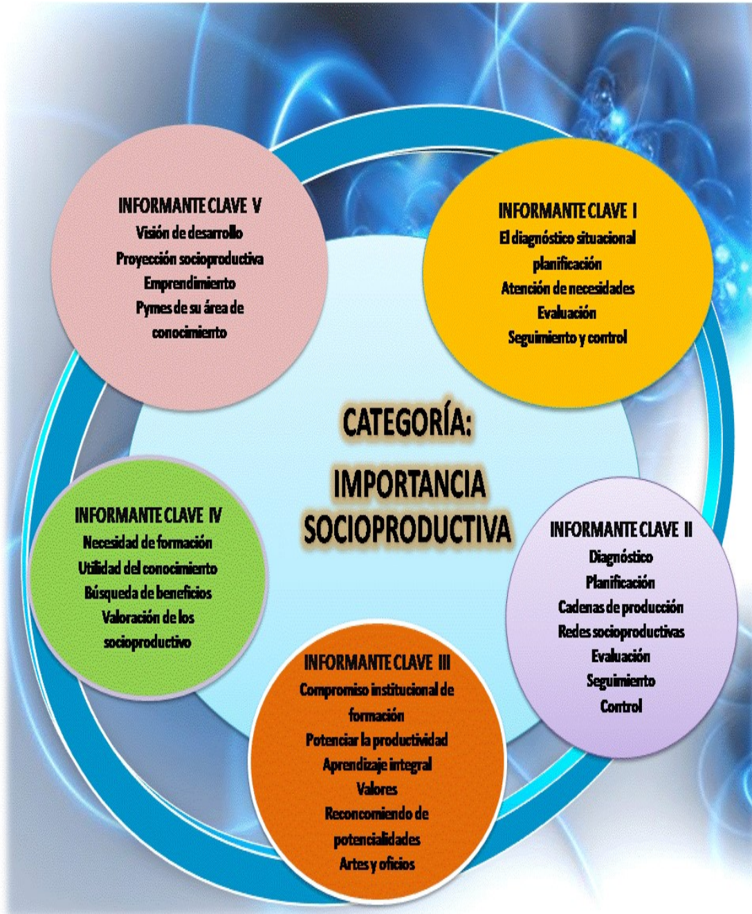
Figura 1: Estructuración de la Categoría: Importancia Socioproductiva.