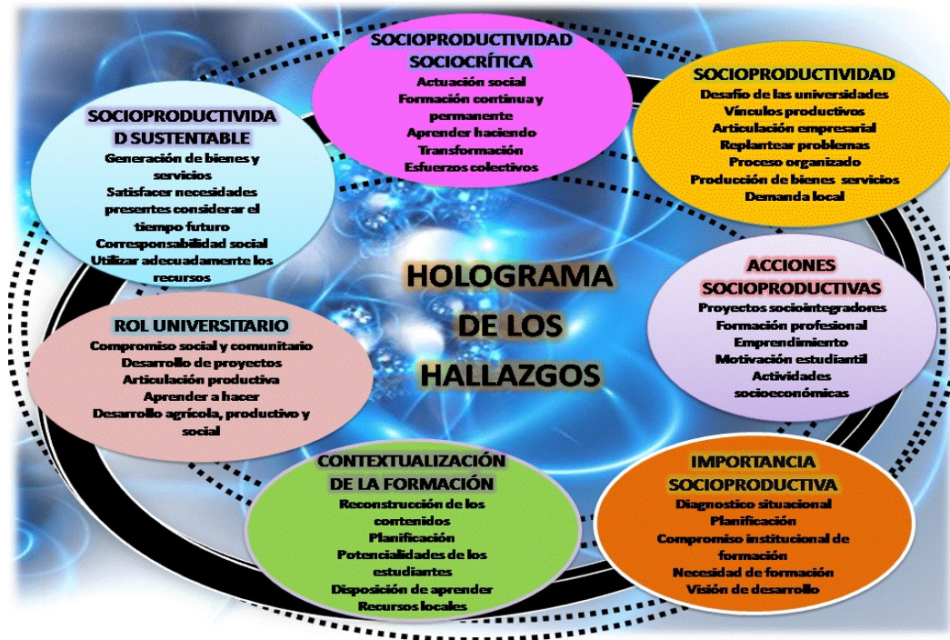
Figura 11: Holograma de los hallazgos.

Toda esta realidad develada en estas técnicas de recolección de la información permitió el desarrollo de un holograma en donde se integran esas categorías y subcategorías emergentes, el cual se expone a continuación: