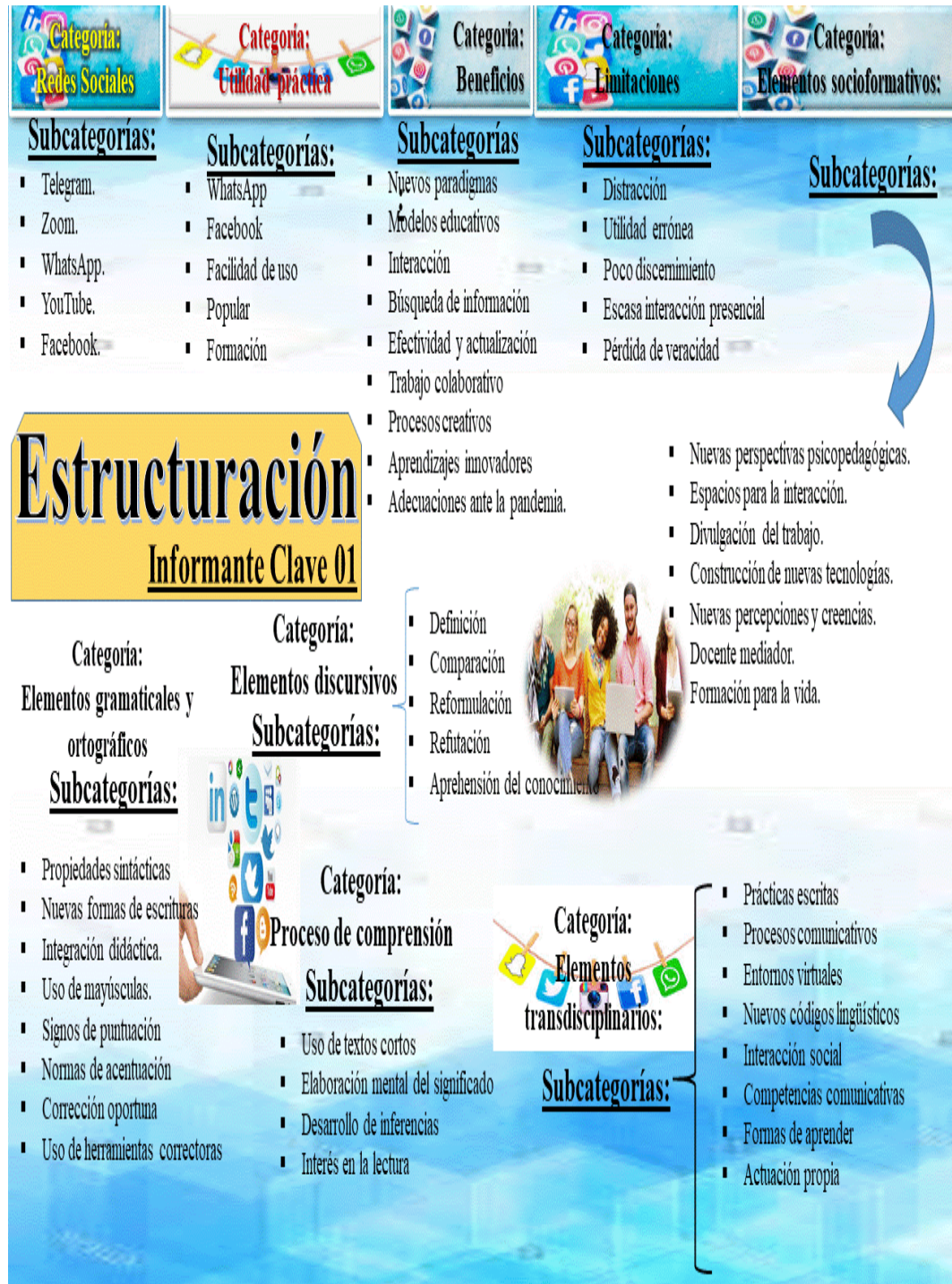
Figura 1: Estructuración del informante clave N°01.

De igual manera se llevo a cabo un proceso de estructuración, que se resume en la siguiente imagen: