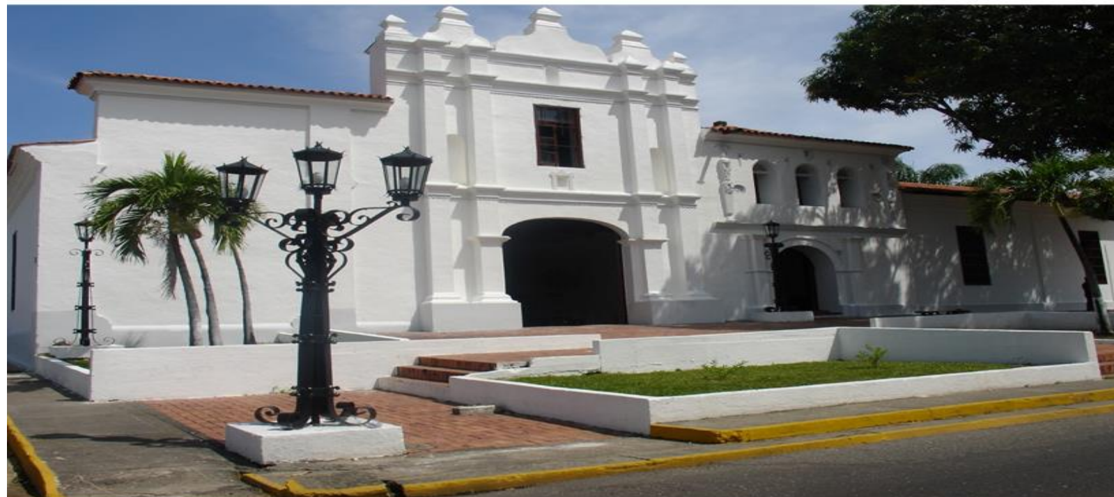
Antiguo Convento de San Francisco, sede del Vicerrectorado de Producción Agrícola.

N° 2/AÑO 4. enero-junio 2024. Depósito Legal: BA2021000019. UNELLEZ-VPA