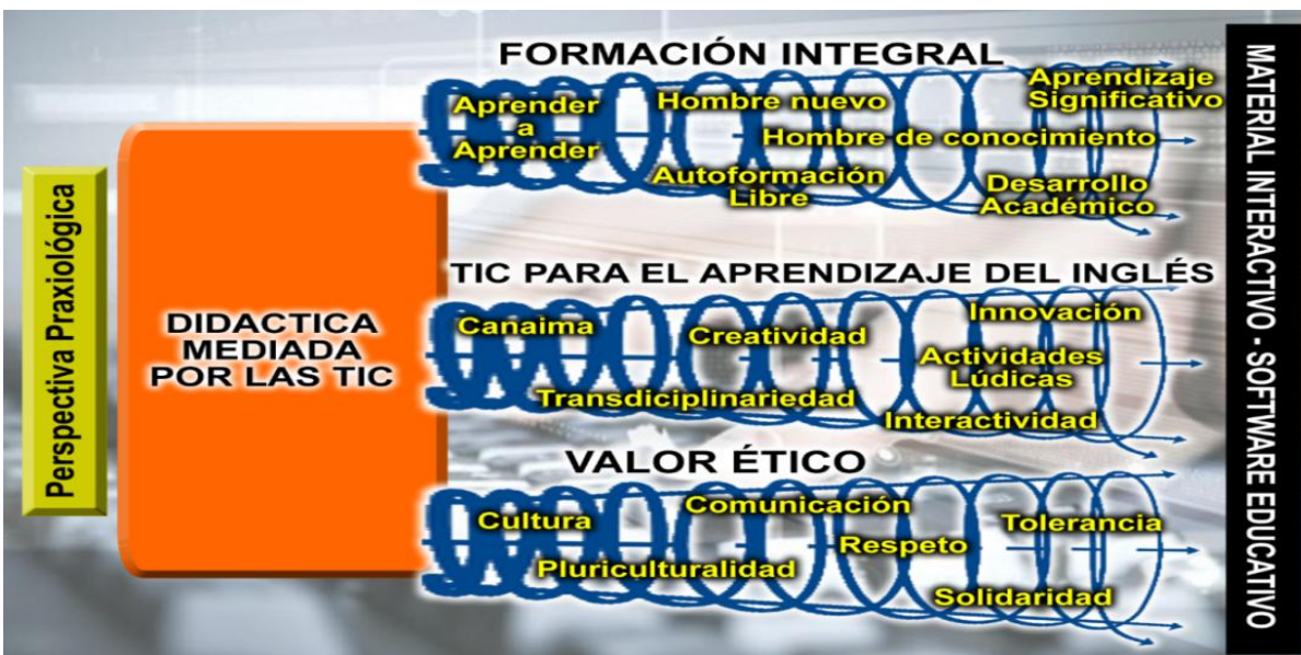
Figura 2. Bucles emergentes desde la perspectiva praxiológica.