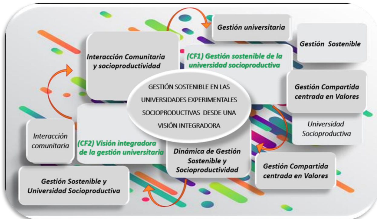
Figura 2. Integración de categorías y subcategorías a través de Atlas.ti. Gestión sostenible de la universidad socioproductiva con una visión integradora.