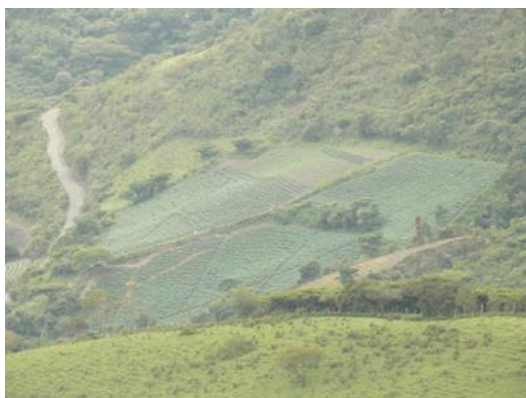
Las Lajitas, Sanare, Estado Lara.