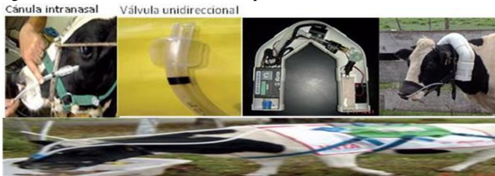
Figura 1. Medición de metano entérico por telemetría.