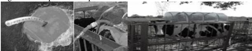
Figura 2. Componentes importantes del modelo experimental.

El volumen de gas de la bolsa de recolección se mide trasvasando el contenido a un recipiente de volumen conocido (25 L). Cuando el remanente es inferior a 25 L, se utiliza un espirómetro (SPIROBANK, Italia) para determinar el volumen restante. El gas recolectado en la bolsa de muestreo, se analiza para \text{CH}_4 por medio de un detector comercial (RIKEN KEIKI, Japón) calibrado por un sistema de dilución con controladores de flujo de masa (Berra, Finster y Valtorta, 2009).