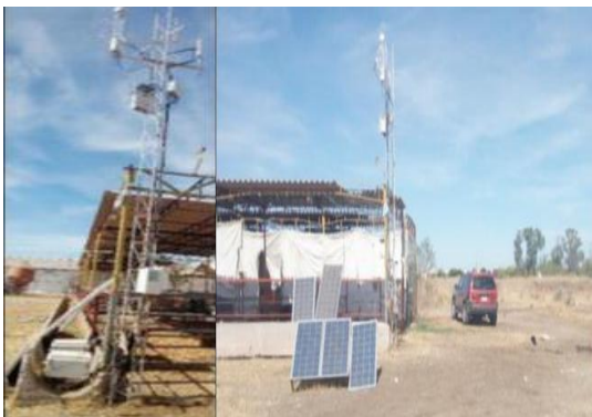
Figura 3. Arreglo y disposición espacial del sistema de covarianza de vórtices y localización de los corrales de ordeña con relación al sistema.

Las variables ( \text{CH}_4 , \text{CO}_2 y \text{H}_2\text{O} ) son muestreadas a 10 Hz y almacenadas en una memoria USB de 16 Gb en el módulo LI-7550, creando archivos cada 30 min, con 18.000 registros cada uno. Los datos se almacenan dentro del LI-7550 se colectan periódicamente y se procesan usando software EddyPro versión 6.2.