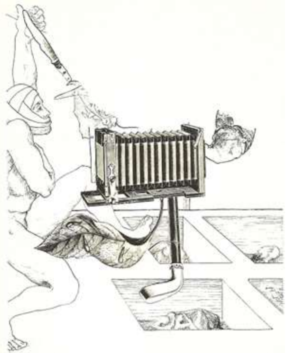
Ilustración de Ludwig Zeller y Susana Wald (1980), tomada de la Revista Escandalar, New York.

Algunas Veces, Casi Nunca y Nunca. El instrumento se validará haciendo uso del juicio de tres (3) expertos. La confiabilidad será realizada a través del cálculo del coeficiente Alfa de Cronbach. Luego de aplicado el instrumento se procederá a la respectiva tabulación, la cual se hará usando la estadística descriptiva, lo que dará lugar al análisis e interpretación de los datos. Y, así expresar las conclusiones y recomendaciones que arroje la investigación.