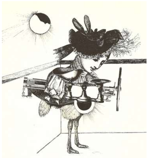
Ilustración de Ludwig Zeller y Susana Wald (1980), tomada de la Revista Escandalar, New York.

Lo expresado, hace ver la necesidad en los docentes y representantes en revisar las conductas de los jóvenes dedicando más atención a las sonrisas, miradas, y acercamientos de manera a colaborar en gran medida en el desarrollo de la autoestima del adolescente.