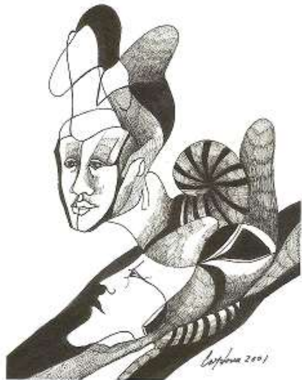
Ilustración de Alfredo Cardona (2001), tomada de la Revista El Buho , de México.

los problemas para establecer prioridades políticas desde el orden interno y sus presiones sectoriales, regionales y de clientelas políticas que afectan las capacidades de los Estados en asumir posiciones de liderazgo o de mantener su posición durante largo tiempo. En esta segunda parte discutimos alrededor del problema de los niveles de análisis, debate clásico dentro la disciplina de Relaciones internacionales, que permite indagar de manera más específica, mirando dentro de los elementos del Estado.